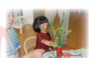
野の花で生花をして、とよから、お月見団子を作って、十五夜をお祝いしました。