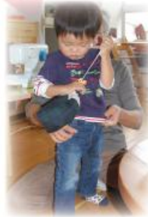
ペットボトル ホルダー (ぽかぽか家)