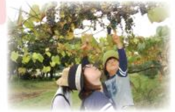
山大農場…。山羊にやまぶどうにみるものたくさんです。