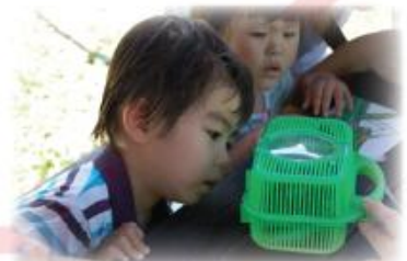
ちょこっと外に出ると、虫がたくさん遊んでいます。これは何の虫かな？

雨の日は、ぽかぽか森の小さなお家の中（三瀬保育園内の一室）で絵本を読んだり、積み木で遊んだり、ちくちく縫い物をしたり、こトこトお料理をしたり、森や海で拾い集めた自然物で作る工作、身近な素材を使ったあそびを楽しんだりしましょう。